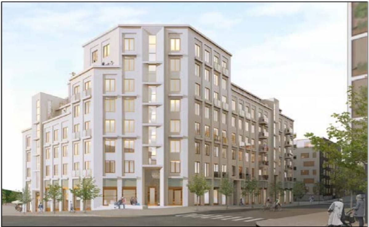
Möjligt resultat i Centrala Nacka Nya Gatan 2022. Bild: VERA arkitekter.