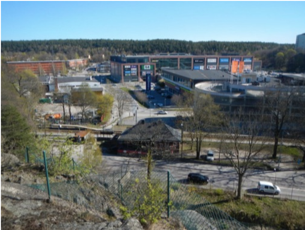
Bild från Svindersberg ner mot Värmdövägen, Nacka station och Sickla Köpvarter. Planiavägen planeras passera under Saltsjöbanan som höjs upp och stationen och stationshuset tas bort. Bostäder byggs på berget och längs Värmdövägen.