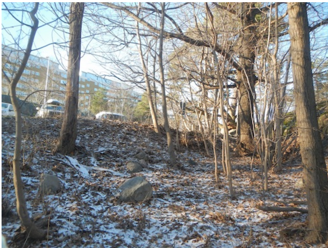
Stora delar av skogen Trolldalen vid Henriksdal försvinner

exploatering av små grönområden i eller i anslutning till befintlig bebyggelse. Naturmark har exploaterats på västra Kvarnholmen, vid Danvikshem och kommer att försvinna vid Henriksdal, vid Stadshuset, vid Jarlabergsvägen, vid Lokomobilvägen, på Svindersberg för att nämna några exempel.