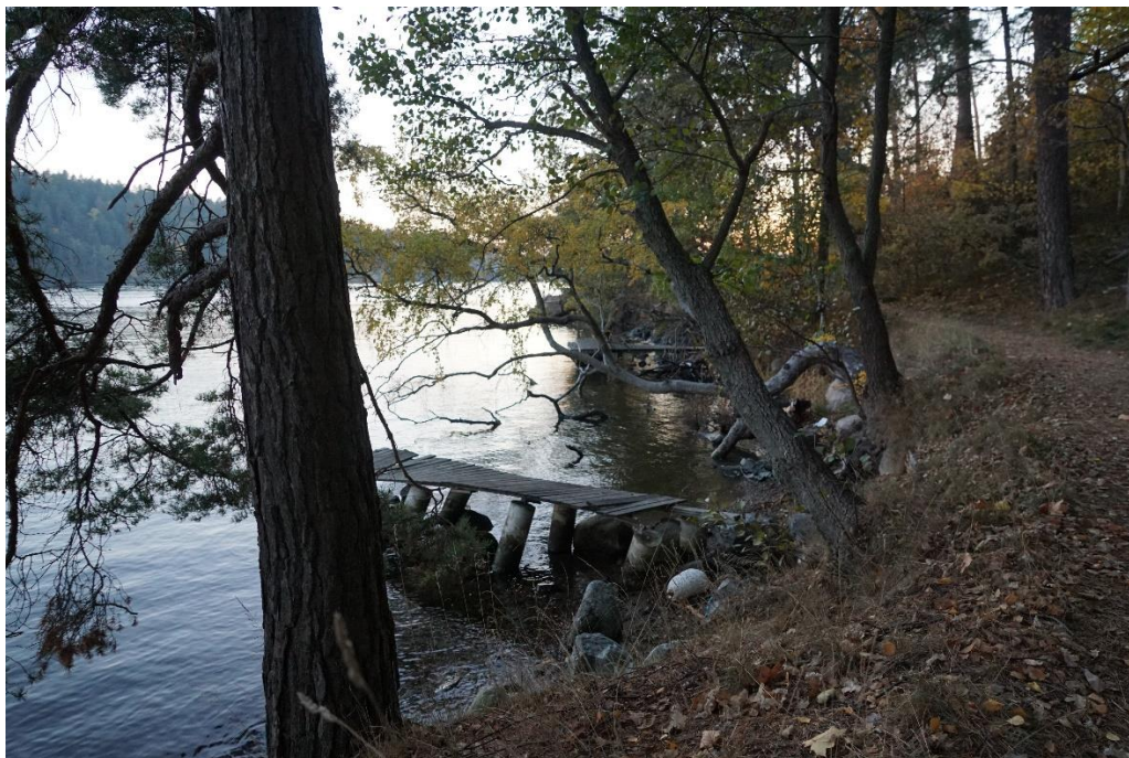
Här ses några bryggor som är i mycket dåligt skick och som bör rivas.