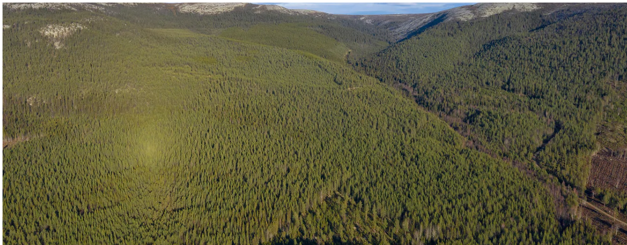
Skorvdalen i november.

I över 30 minusgrader i slutet på januari 2014 är mark- och miljödomstolens ledamöter, representanter för projektet och Naturskyddsföreningen för första gången på plats och pulsar i snön i den ännu orörda dalen för att bilda sig en uppfattning om vad som står på spel. Bara några veckor senare kommer domen. Mark- och miljödomstolen anser att skyddet av kungsörn går före bygget av en skidanläggning i Skorvdalen och upphävde länsstyrelsens beslut och avslår bolagets ansökan om dispens från artskyddsförordningen.